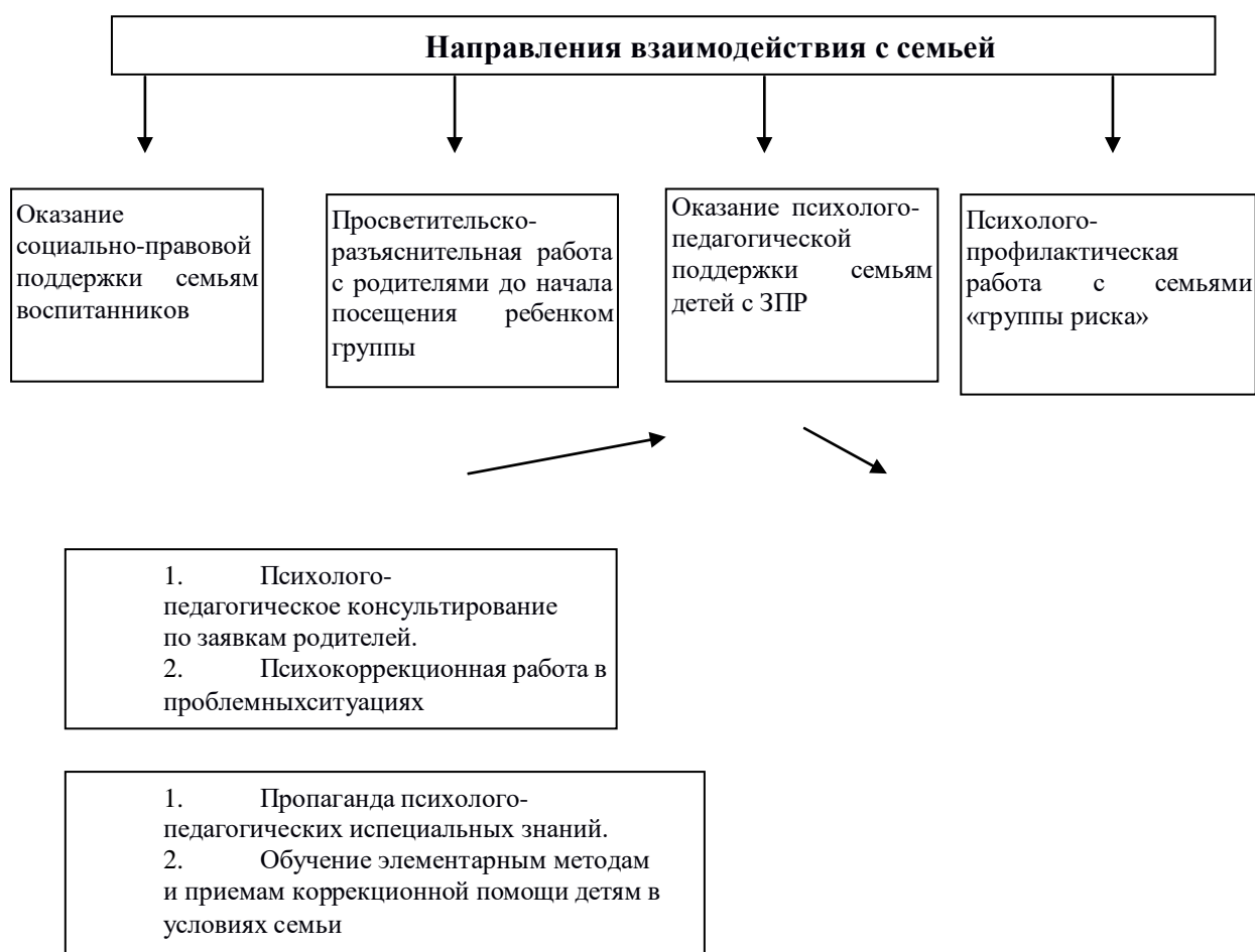
Схема 1. Основные направления взаимодействия ДООУ с родителями воспитанников с ЗПР

6. поощрение родителей за внимательное отношение к разнообразным стремлениям и потребностям ребенка, создание необходимых условий для их удовлетворения в семье. Адаптированная образовательная программа обсуждается и реализуется с участием родителей (законных представителей) ребенка. В основу сотрудничества положено взаимодействие «психолог - педагоги - родитель». При этом активная позиция в этой системе принадлежит психологу, который изучает и анализирует психологические и личностные особенности развития детей. Психолог не только создает условия для развития эмоционально-волевой и познавательной сферы ребенка, но и создает условия для сохранения психологического здоровья детей, организует работу по предупреждению эмоциональных расстройств, снятию психологического напряжения всех участников коррекционно-образовательного процесса.